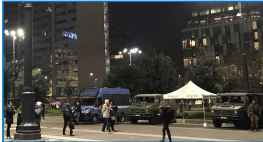
警戒する治安部隊(24時間体制)